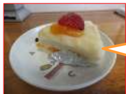
アレルギー食も対応しています。