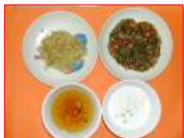
離乳食は発達に応じて

また、離乳食やアレルギー症状等、一人ひとりの園児に合わせた内容で調理しています。