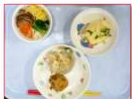
幼児食もおいしそう♪