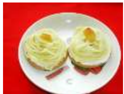
手作りモンブラン(おやつ)