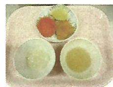
★離乳食は発達に応じて

また、離乳食やアレルギー症状など、一人ひとりの園児に合わせた内容で調理しています。