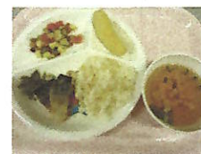
★幼児食もおいしそう