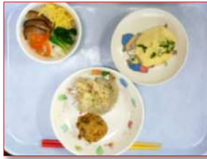
幼児食（アレルギー食も対応しています！）