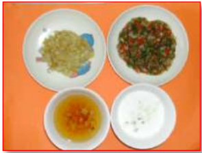
★離乳食は発達に応じて

また、離乳食やアレルギー症状等、一人ひとりの園児に合わせた内容で調理しています。