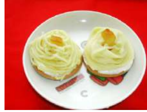
手作りモンブラン♡